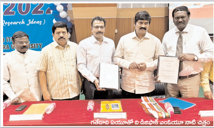
గతేడాది ఏఝాలో ది డిజిఫాక్ ఎంఓఝా నాటి చిత్రం